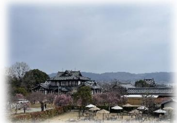
郡山城展望台から街並みを望む

大和郡山駅は京都駅から長谷寺駅の途中にありますので、ぜひ、旅行先の候補にさせていただければと思います。